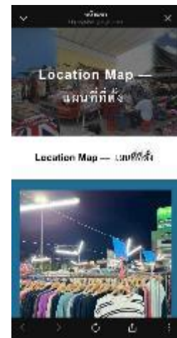
ภาพที่ 4 หน้าจอแสดงตำแหน่งตลาดนัดและพิกัดสถานที่