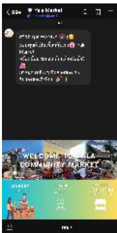
ภาพที่ 2 หน้าจอของผู้ใช้งานทั่วไป