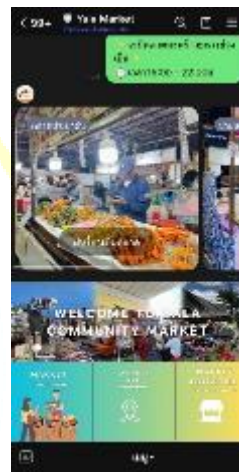
ภาพที่ 6 หน้าจอเมนูของกินของฝาก แสดงรายการสินค้าที่มีจำหน่ายภายใน

จากภาพที่ 2 แสดงหน้าจอของระบบ Line Official Account (Line OA) ของตลาดนัดชุมชน ซึ่งเป็นส่วนที่ผู้ใช้งานทั่วไปสามารถเข้าถึงได้เมื่อเพิ่มเพื่อน โดยหน้าจอดังกล่าวมีเมนูหลักให้เลือก ได้แก่