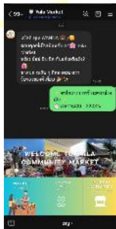
ภาพที่ 5 หน้าจอเมนู แสดงกิจกรรมของตลาดนัด