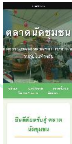
ภาพที่ 3 แสดงหน้าจอหลักของเว็บไซต์ ตลาดนัดชุมชน